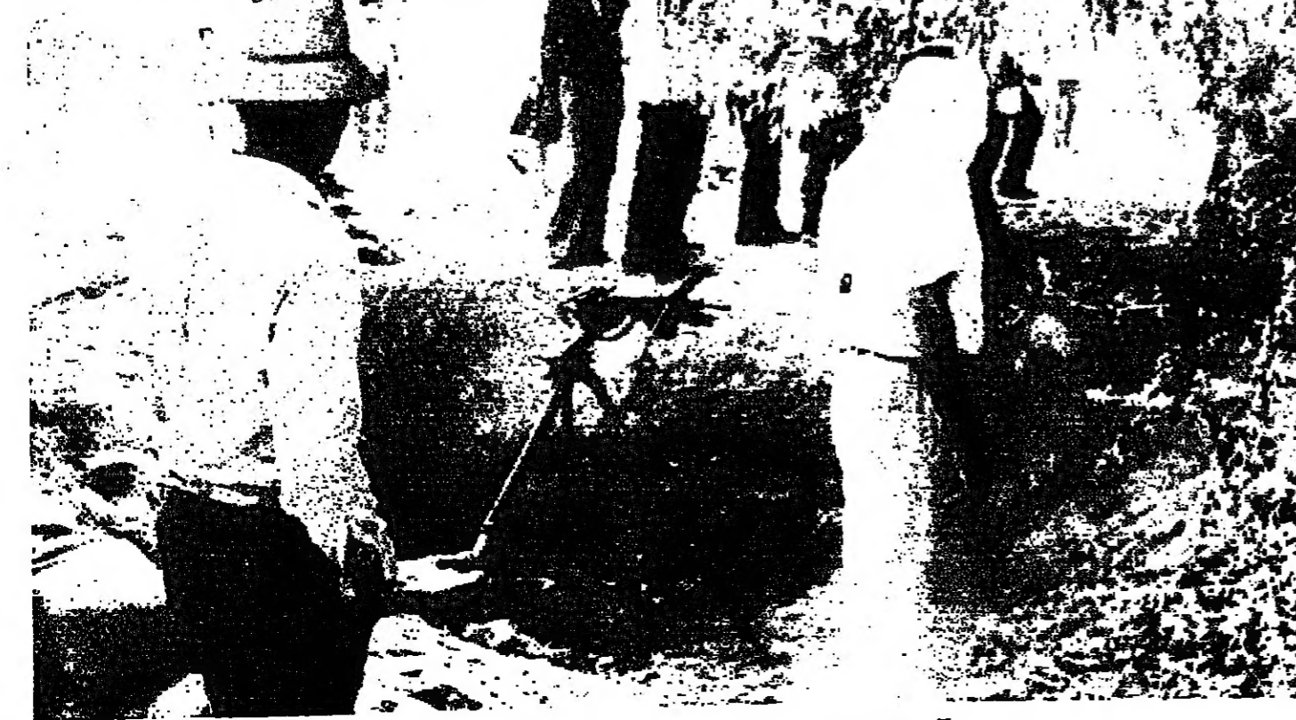
في مخيم البص بعد العدوان